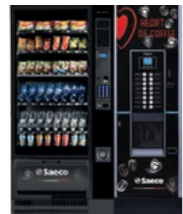
Artico L + Cristallo Evo 600